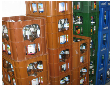
Bevorzugen Sie Glas-Mehrwegflaschen

Meist sind Mehrwegflaschen deutlich klimafreundlicher als Einwegflaschen, wie etwa PET-Flaschen.