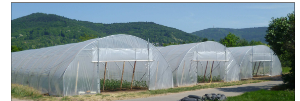
Verzichten Sie auf Treibhausware