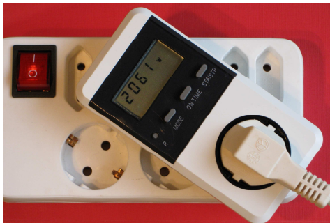
Strommessgerät im Einsatz