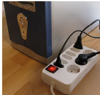
Mehrfachsteckdosenleiste mit Netzschalter

Leerlaufverluste lassen sich nur durch konsequentes Ausschalten und Verzicht auf den „Stand-by“ Betrieb vermeiden. Ist dies nicht möglich, da Geräte über keinen Netzschalter verfügen oder sich nicht komplett ausschalten lassen (Schein-Aus), hilft nur das Trennen vom Stromnetz. Dabei hat sich die Verwendung von schaltbaren Steckdosenleisten sehr bewährt. Mit deren Hilfe lassen sich etwa Computer, Monitor und Drucker nach dem Herunterfahren schnell und bequem mit nur einem Schalter vom Stromnetz trennen.